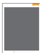
1/1 Seite 190 x 238 mm)