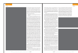
1/2 Seite hoch 112 x 238 mm 1/4 Seite 112 x 118 mm 1/8 Seite 112 x 55 mm